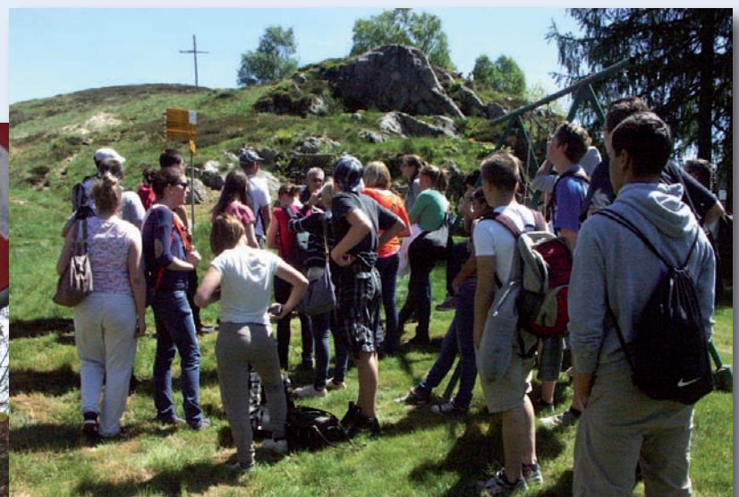
Ausflug nach Cardada oberhalb Orselina TI mit den Konfirmanden