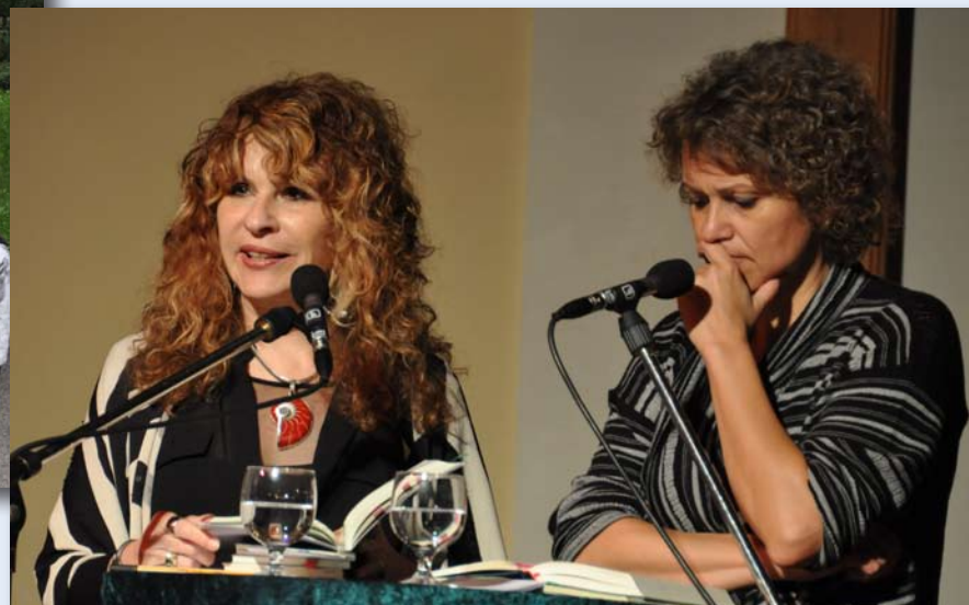
Lesung mit der Schriftstellerin und Lyrikerin Gioconda Belli aus Nicaragua