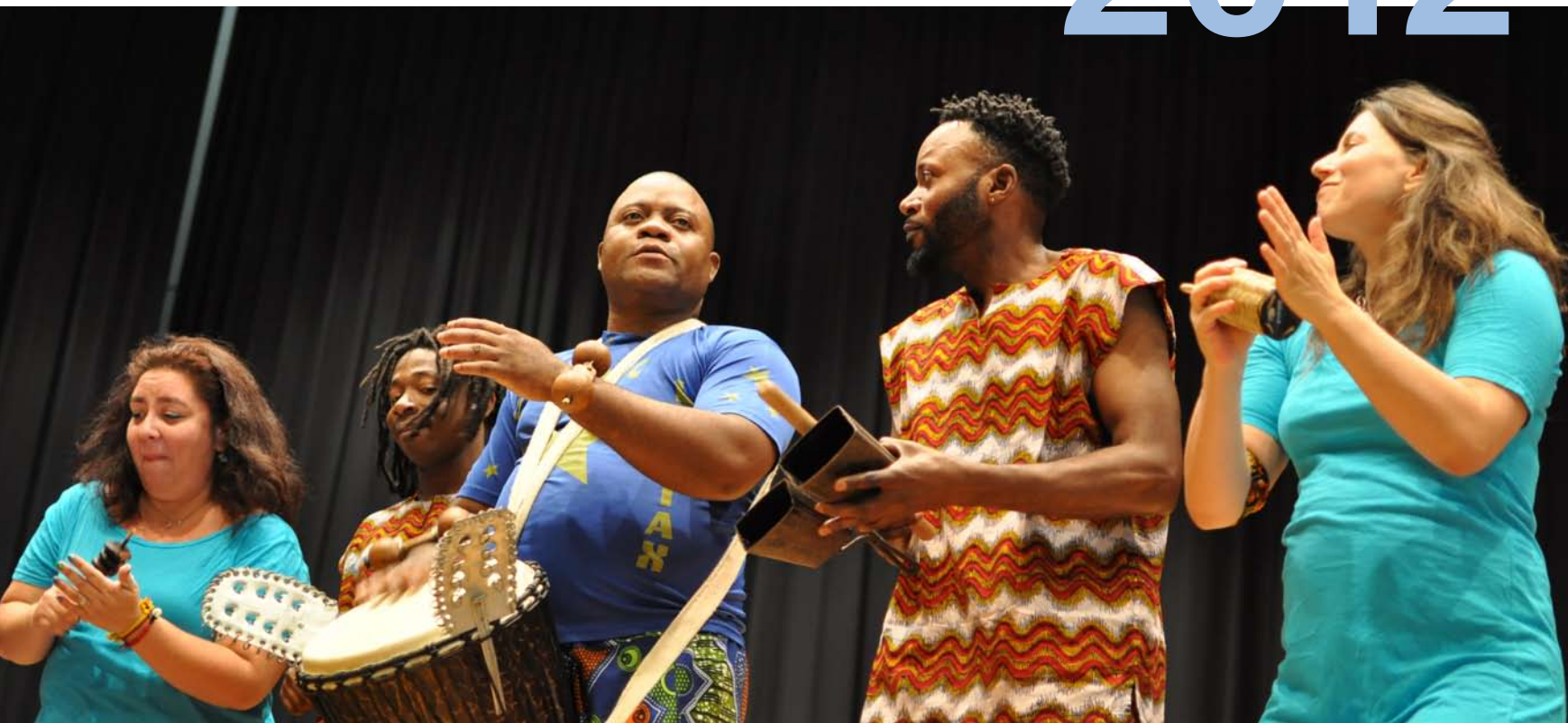
Tanzgruppe PiliPili am Begegnungsfest