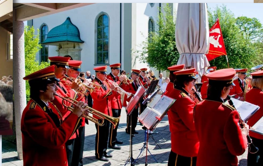
Ständli mit der Stadtmusik Kloten nach deren Mitwirkung im Gottesdienst