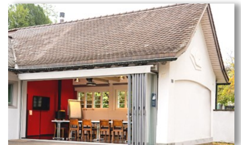
Atrium, altes Friedhofgebäude