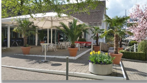
Terrasse Kirchgemeindehaus und grosser Saal

Die Räume im Kirchgemeindehaus, Atrium, Blauer Zinken und Jurte stehen Privatpersonen sowie anderen Institutionen im Rahmen des Vermietungsreglements zur Verfügung.