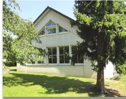
Jugendhaus Blauer Zinken